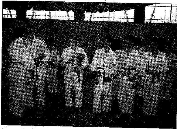
Les remises de récompenses se sont déroulées tout au long de la soirée