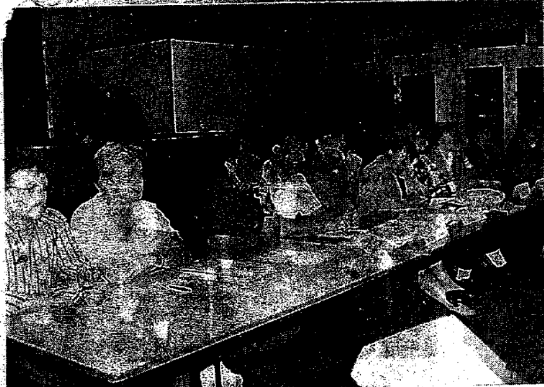
Le nouveau bureau au complet.