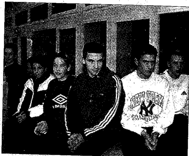
A la proclamation des résultats, les jeunes judokas ont été applaudis par le public