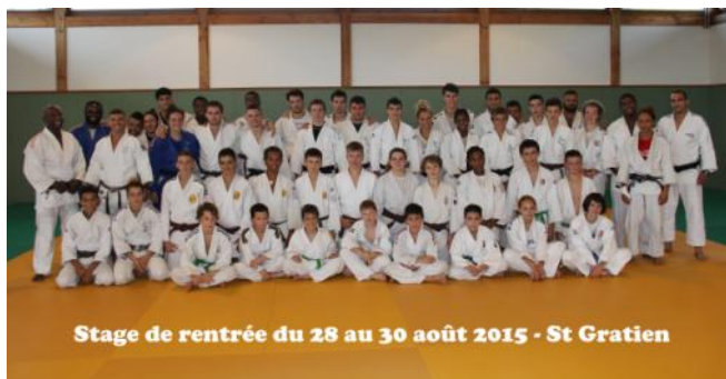
Stage de rentrée du 28 au 30 août 2015 - St Gratien

Cette année, le stage de rentrée s'est déroulée à St Gratien du 28 au 30 août. Une première qui a permis de découvrir des structures très performantes et de se rendre compte que, comme à Blanc-Mesnil, la participation de judokas de très haut niveau se fait facilement grâce aux contacts déjà existants. C'est pour cela qu'en plus des judokas de St Gratien, d'autres sont venus de Gennevilliers, d'Eaubonne, de Blanc Mesnil ... Certains de ni-